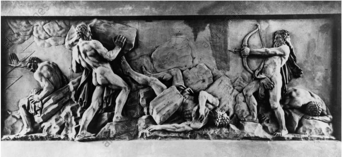
Ecce „HERCULES ET GIGANTES IMPETUM FACIENTES“. Sculptura ectypa, quam annis 1788-91) confecit Carl Gotthard LANGHANS (1732-1808). Haec sculptura invenitur in Berolinensi PORTA BRANDENBURGICA.

attractarent; alter Venerem iam dicebat uxorem suam, alter Dianam, tertius Minervam in matrimonium ducere cupiebat. Itaque montes Thessalicos accedentes in caelum impetum facturi.